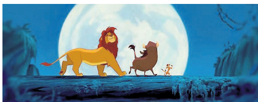
LØVENES KONGE: Simba, Pumba og Timon er tilbake i 3D.

Dette er til stor glede for alle utenom Scar, Mufasas slemme bror, som selv ønsker å overta tronen.